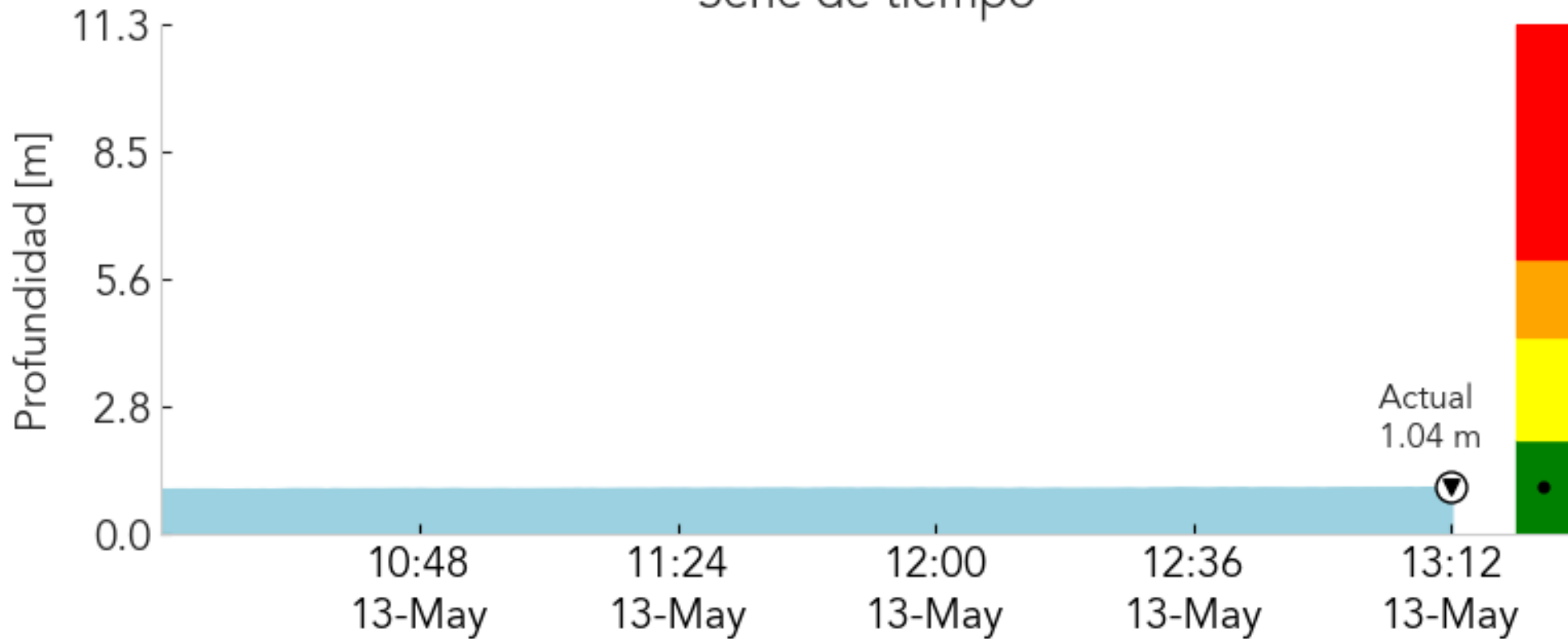
Sección transversal 2022-05-13 13:12:00