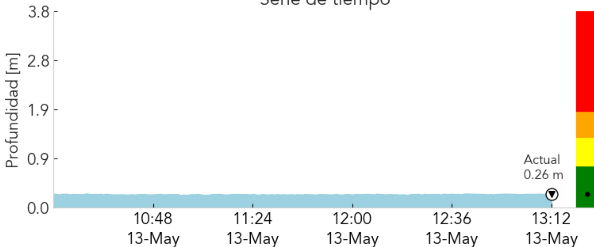
Sección transversal 2022-05-13 13:12:00