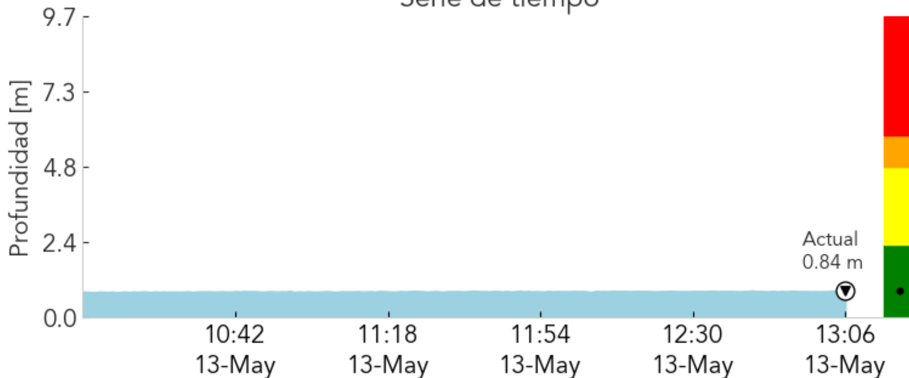
Sección transversal 2022-05-13 13:06:00