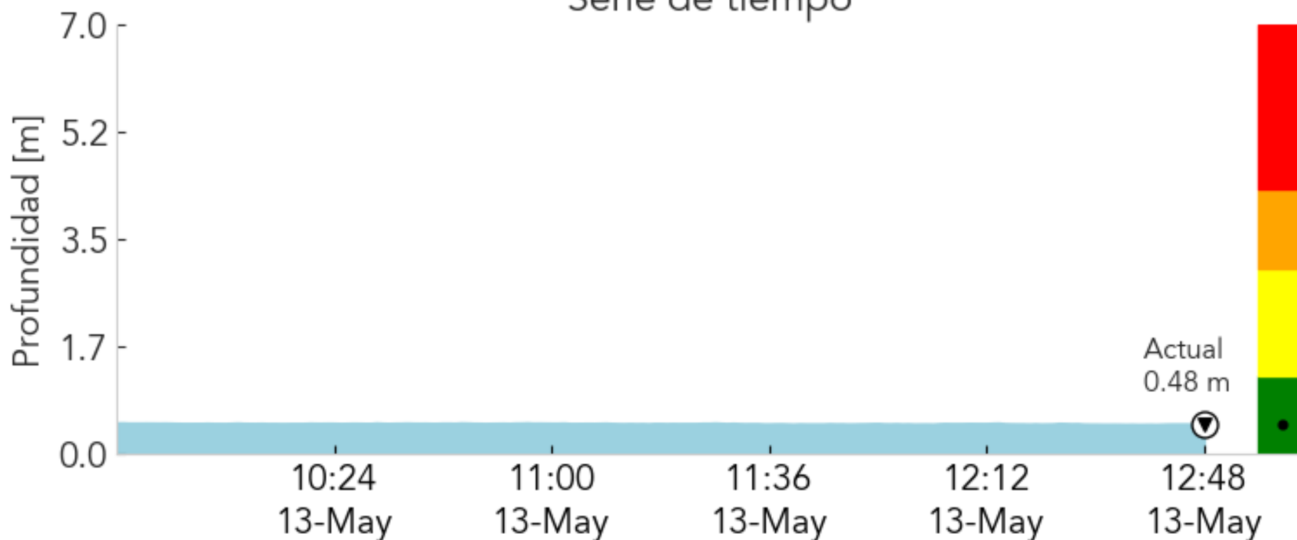
Sección transversal 2022-05-13 12:48:00