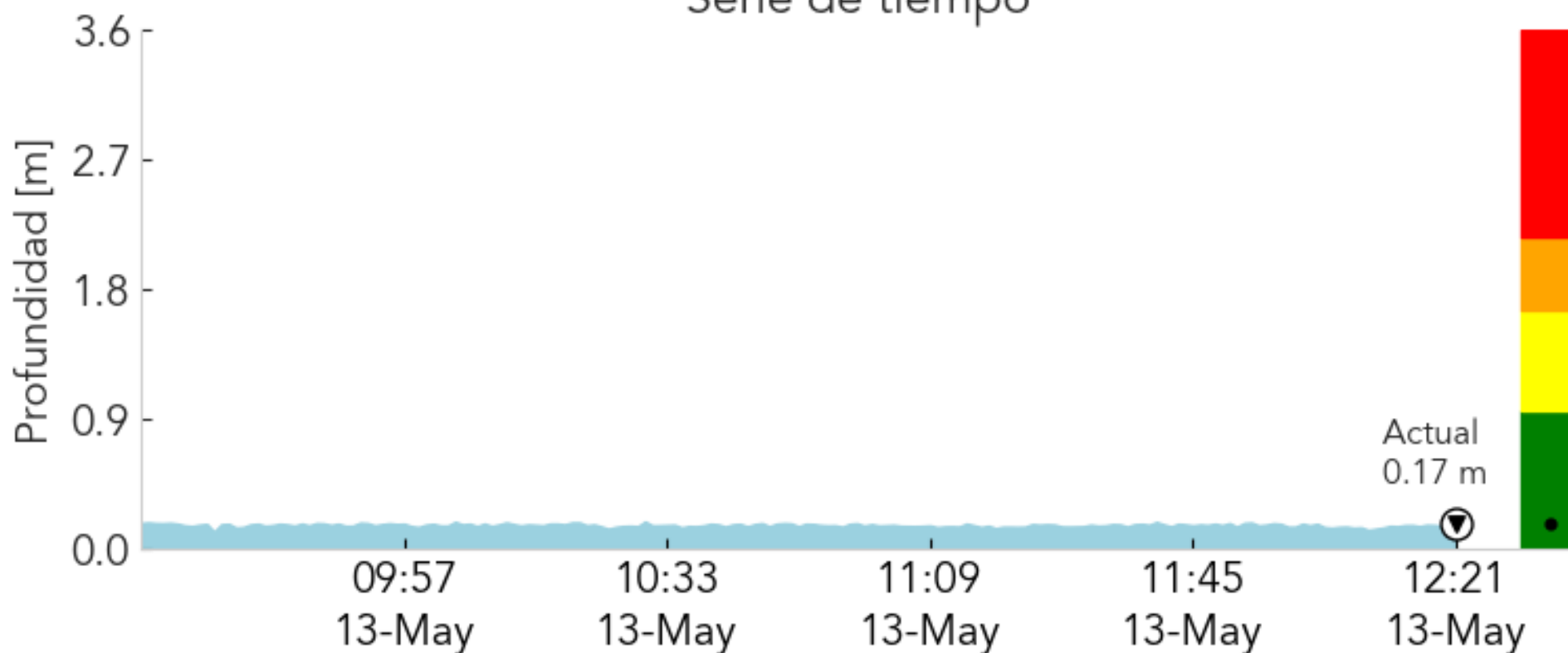
Sección transversal 2022-05-13 12:21:00