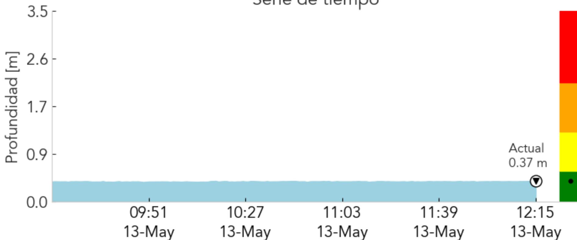
Sección transversal 2022-05-13 12:15:00