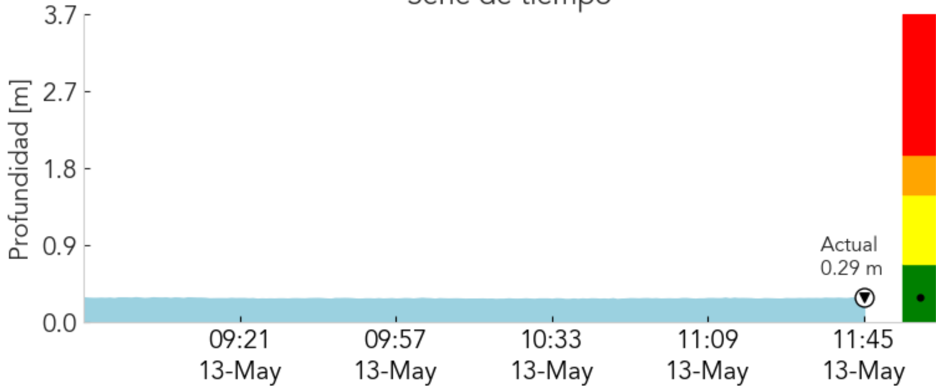
Sección transversal 2022-05-13 11:45:00