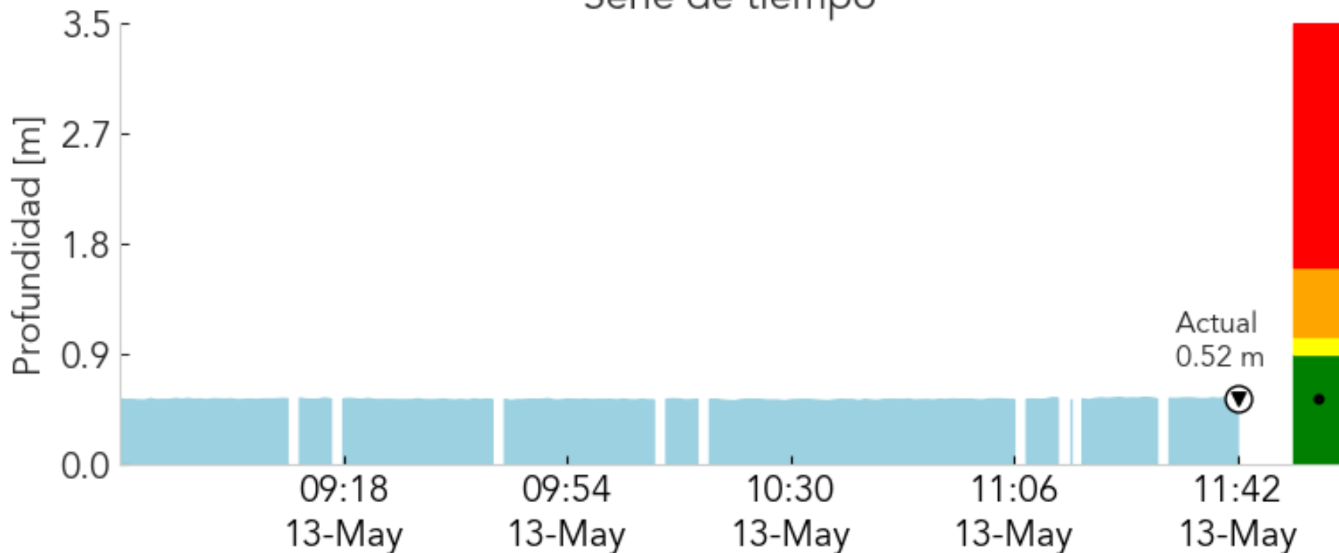
Sección transversal 2022-05-13 11:42:00