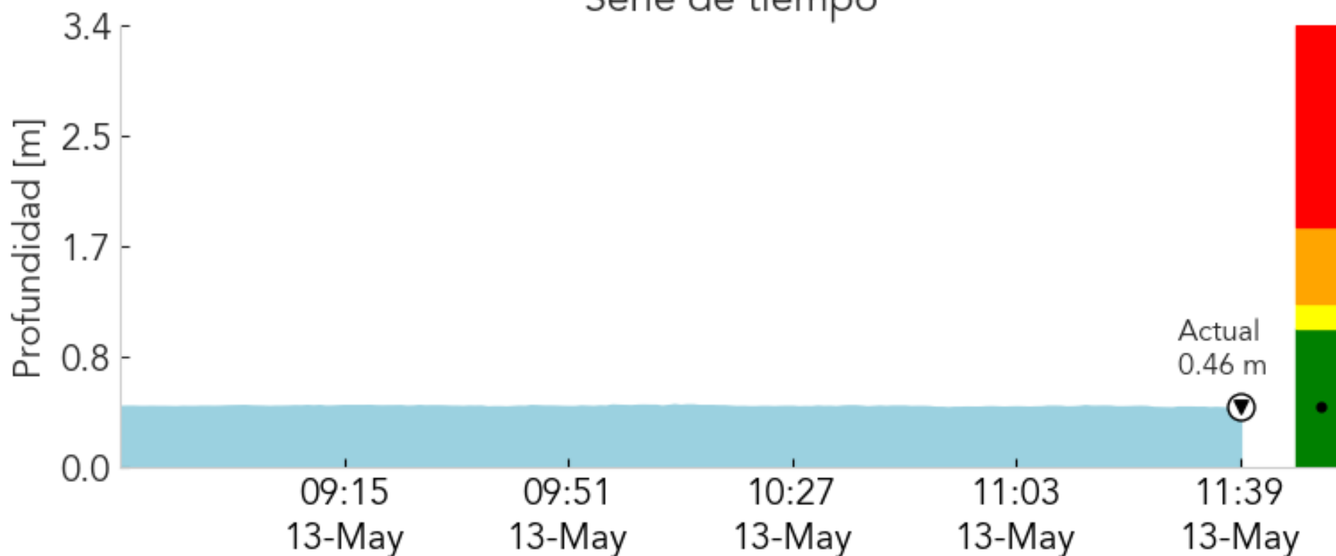
Sección transversal 2022-05-13 11:39:00