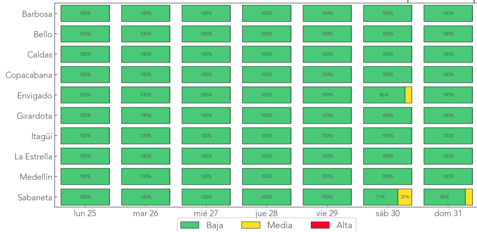
Resumen Semanal: Probabilidad de Movimientos en Masa por municipio

Durante la última semana no se registraron veredas o barrios con 3 o más días en alerta roja.