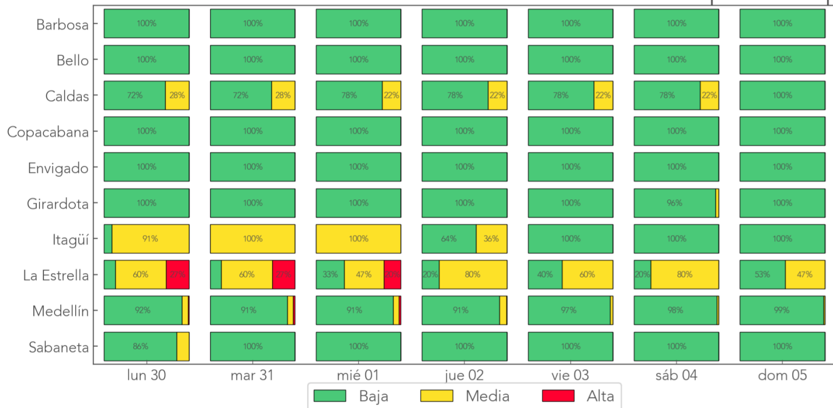
Resumen Semanal: Probabilidad de Movimientos en Masa por municipio

Durante la última semana, las veredas o barrios que registraron 3 o más días en alerta roja fueron, La Estrella: el 21%. Medellín: Montañita y San José.